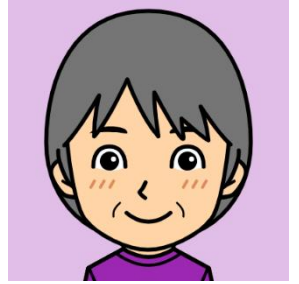
Tさん 巳年の12月生まれ。東京都出身。40代から野田在住。お料理が得意な素敵な奥様です。